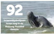
92 Irrawaddydolfijnen leven nog in de Mekong Flooded Forests

BRON VAN LEVEN De Mekong biedt nog veel meer. In Cambodja, Vietnam en Laos samen hangen 60 miljoen mensen af van de visserij, die jaarlijks 11 miljard dollar oplevert. En wanneer de rivier tijdens het regenseizoen buiten haar oevers treedt, is dat niet alleen een zegen voor rijstboeren, het is ook de bron van uit-zonderlijk veel leven. Honderden uitzonderlijke soorten zoals de Mekongkatvis en de zoetwater-rog, die 200 kilo kunnen wegen, de mutslangser-