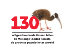
130 witgeschouderde ibissen tellen de Mekong Flooded Forests de grootste populatie ter wereld

(een aap) en de schrikvallende Cantors reuzenweeskildpad wonen hier.