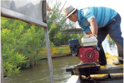
En van de rivierbewakers maakt zich klaar om uit te varen. De dolfijn beschermen is onszelf beschermen.’

“We hebben ook een nieuwe milieuminister die